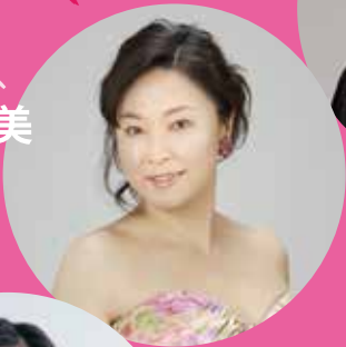
ケルビーノ 石田滉 メゾソプラノ