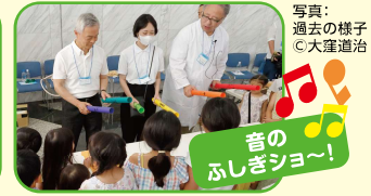
音のふしぎショー!