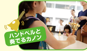
ハンドベルと奏でるカノン

会場:第一生命ホール内 13:00~14:50 (チケットをお持ちの方は途中入退場自由/最終入館は14:30まで) [先着・要申込]