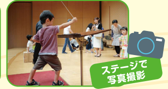
ステージで写真撮影