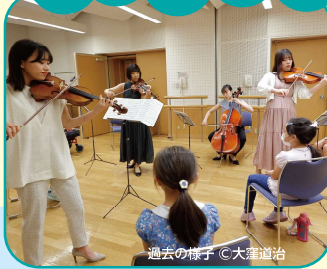
過去の様子 ©大塚道治

*1回の受付で、お子様1名様(保護者は立見で同伴1名様まで)のみ申し込み可 *大人のみのご入場は不可 *2回とも同じ内容です。