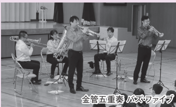
金管五重奏 バズファイブ

※ホームページにレポートを随時更新しております。「コミュニティ活動」の「コミュニティ活動レポート」をご覧ください。