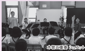
木管五重奏シュエット