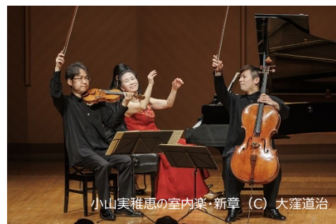
小山実稚恵の室内楽・新章