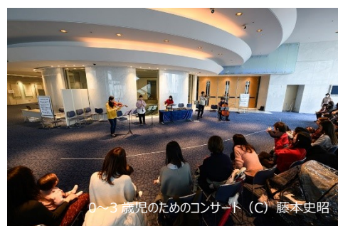
0～3 歳児のためのコンサート

「子どもといっしょにクラシック」では、ロビーでの「0～3 歳児のためのコンサート」を年 3 回、ホールで 4 歳以上入場可とするコンサートを年 3 回実施。コロナ禍で歌えない時期が続いた子どもたちのために企画した「心にひびく歌のコンサート」は券売数に課題は残りましたが、合唱と絵本のコラボレーションにも挑戦でき、顧客満足度も非常に高いコンサートとなりました。「クリスマス・オーケストラ・コンサート」は 1 日 3 回公演がほぼ完売、「音楽と絵本コンサート『うきわねこ』」は再演であることも活かして、より充実した内容をおおくりできたと思います。なお、過去の「音楽と絵本」作品から 2023 年度も、「ぴっぽのたび」「おまえうまそうだな」が、地方のホールに企画を提供する形で上演されました。