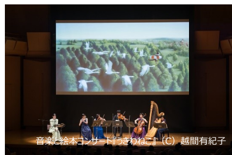
音楽と絵本コンサート『うきわねこ』