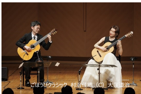
ごほうびクラシック 村治佳織

同じく 2 年目を迎えた「ごほうびクラシック」シリーズは、村治佳織のソロとデュオをはじめ、東京メトロポリタン・プラス・クインテット、葵トリオ（ピアノ三重奏）、若手ピアニスト 4 人が集った「ピアノ・オールスターズ II」など 4 回の公演を行い、多くの新規のお客さま、そして U25 券で若い層のお客さまにもご来場いただきました。開場時のストレッチコーナー、アフタートーク、キッズ企画、公演動画プレミア公開、トリトン内飲食店クーポン配布など、公演に付随して様々なことを試みています。